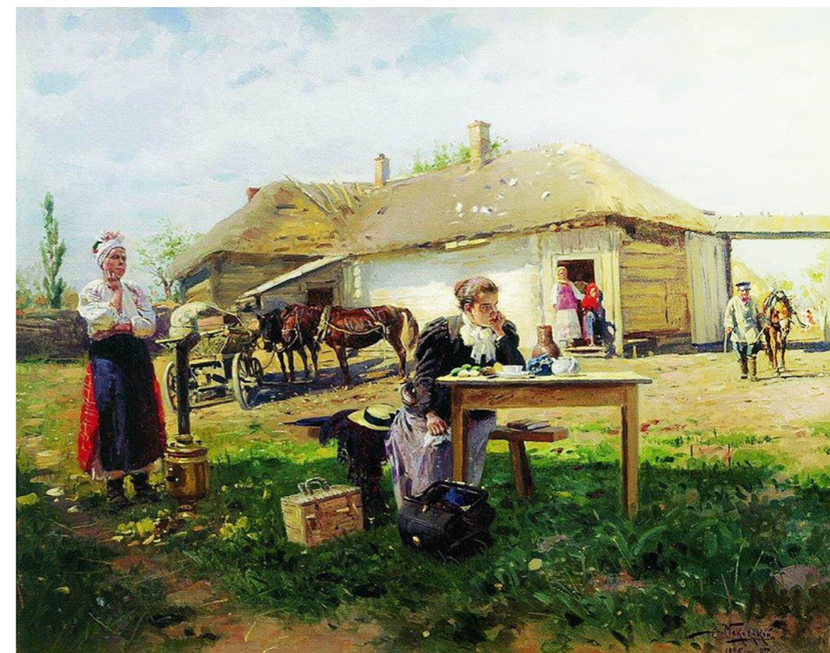
Владимир МАКОВСКИЙ «Приезд учительницы в деревню», 1897